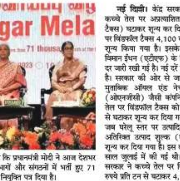
सीतारमण ने रोजगार पाने वालों को दी सलाह, कहा- दूसरों को भी रोजगार मेला योजना के बारे में बताइए

चेन्नई/नई दिल्ली। केंद्रीय वित्त मंत्री निर्मला सीतारमण ने रोजगार मेला योजना के तहत नौकरी पाने वालों को सलाह दी है कि वे दूसरे लोगों को भी इस योजना के फायदे बताएं। सीतारमण ने चेन्नई में आयोजित एक कार्यक्रम में लगभग 250 लोगों को नियुक्ति पत्र दिए। वित्त मंत्री ने 'श्रम विभाग, रेलवे, स्वास्थ्य और परिवार कल्याण, पेट्रोलियम और रक्षा सहित विभिन्न मंत्रालयों और विभागों में नई भरतियों के लिए करीब 250 लोगों को नियुक्ति पत्र दिए। इस दौरान उन्होंने कहा कि रोजगार सृजन को सर्वोच्च प्राथमिकता देने की प्रधानमंत्री नरेन्द्र मोदी की प्रतिबद्धता को पूरा करने की दिशा में यह एक कदम है। निर्मला सीतारमण ने नवनियुक्त लोगों से बात करते हुए कहा कि आप अपने परिवार के अलावा अन्य लोगों को भी रोजगार मेला योजना के फायदे बताएं और उन्हें अपने जीवन में आगे बढ़ने के लिए कहें। वित्त मंत्री ने कार्यक्रम के दौरान लाभार्थियों के साथ सेल्फ़ी भी