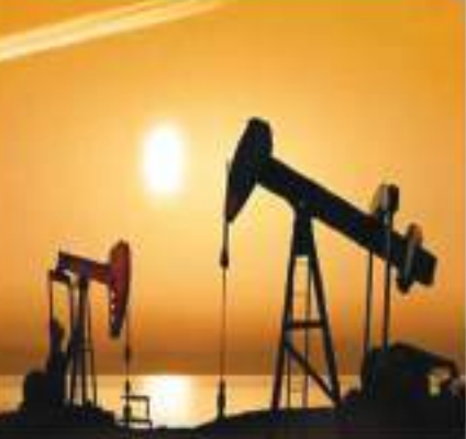
देश में उत्पादित कच्चे तेल पर नहीं लगेगा विडफॉल टैक्स, नई दरें लागू

नई दिल्ली। केंद्र सरकार ने देश में उत्पादित कच्चे तेल पर अप्रत्याशित लाभ कर (विडफॉल टैक्स) घटाकर शून्य कर दिया है। घरेलू कच्चे तेल पर विडफॉल टैक्स 4,100 रुपये प्रति टन से घटाकर शून्य किया गया है। इसके साथ ही डीजल और विमान ईंधन (एटीएफ) के निर्यात पर कर को शून्य दर जारी रखी गई है। नई दरें मंगलवार से लागू हो गई हैं। सरकार की ओर से जारी एक अधिसूचना के मुताबिक ऑयल एंड नेचुरल गैस कॉर्पोरेशन (ओएनजीसी) जैसी कंपनियों के उत्पादित कच्चे तेल पर विडफॉल टैक्स को 4,100 रुपये प्रति टन से घटाकर शून्य कर दिया गया है। यह दूसरी बार है, जब घरेलू स्तर पर उत्पादित तेल के लिए विशेष अतिरिक्त उत्पाद शुल्क (एसएईडी) को घटाकर शून्य कर दिया गया है। इस लेवी की पेशाकश पिछले साल जुलाई में की गई थी। इससे पहले 2 मई को सरकार ने कच्चे तेल पर विडफॉल टैक्स 6,400 रुपये प्रति टन से घटाकर 4,100 रुपये प्रति टन कर दिया था। वहीं, पेट्रोल और डीजल के निर्यात पर लेवी को शून्य कर दिया गया था, जो उसी स्तर पर बनी हुई है। इसी तरह विमान ईंधन (एटीएफ) के निर्यात पर लेवी भी शून्य बनी हुई है।